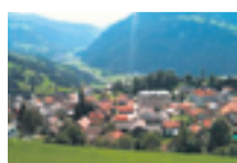
Seewis GR 2010