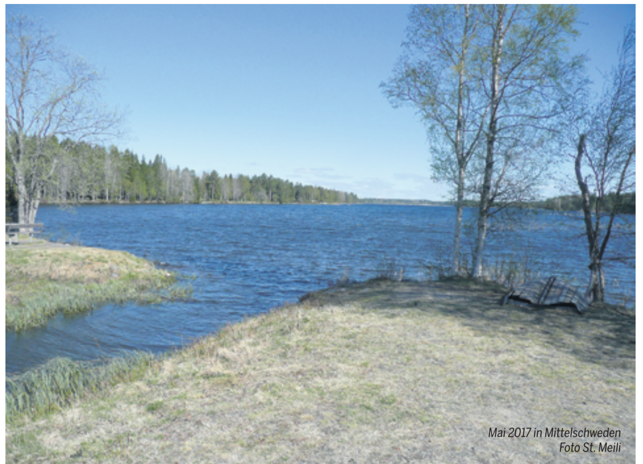
Mai 2017 in Mittelschweden

Buss- und Bettag, 15. September , Moutier, 10.30 Uhr, Jodlerpredigt mit den jurassischen Kirchgemeinden