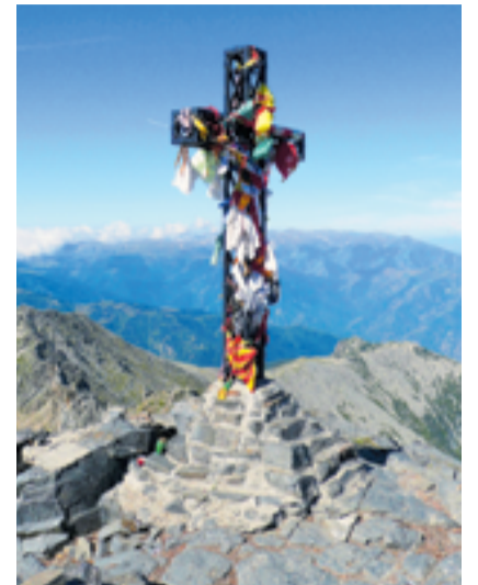
Pic du Canigou

«... Liebe Brüder, wir waren nicht dabei, als der auferstandene Jesus trotz aller Torheit und Trauer seiner Jünger, trotz jener aus lauter Angst verschlossenen Türen in ihre Mitte trat. So direkt wie sie können wir ihn jetzt nicht sehen, werden wir ihn erst zu sehen bekommen, wenn er am Ende aller Tage kommen wird, zu richten die Lebendigen und die Toten. Aber in unserer Weise, indirekt, nämlich im Spiegel der Erzählung und so des Zeugnisses, des Bekenntnisses, der Verkündigung der ersten Gemeinde können und dürfen auch wir ihn jetzt schon sehen. Viele vor uns, ein ganzes Volk von Menschen, haben ihn so gesehen und sind froh geworden. Eben dazu feiern wir Ostern, das Gedächtnis jenes Tages, um uns jenem Volk anzuschliessen, um den Herrn in jenem Spiegel auch zu sehen und also auch froh zu werden. Ohne den Herrn zu sehen, kann niemand froh werden. Wer ihn sieht, der wird froh. Warum sollte das nicht gerade