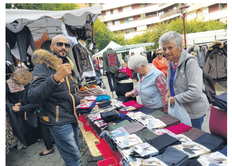
Markt in Thonon-les-Bains.