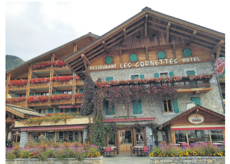
Unser Hotel in la Chapelle d'Abondance.