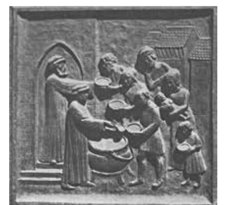
Bild entnommen aus: R.H. Oehninger, Das Zwingliportal am Grossmünster in Zürich, NZZ 3/2004