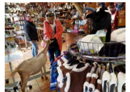
Im Ziegenderf

Sunntig, 24.9. D Sunne isch no nid ufgestande, wo mier z' Renan abfahre. Es paar chlyni, luschtegi Wüchli verziere der Himmel. So nach u nach füllt sich der Car. In Biel chunnt no die letschti Teilnahmmerin derzue. D Sunne isch unterdesse o erwachet. Schön sittig geit es jetz am Bielersee nah. D Böim u d Strücher hei scho ihri bunte Chleider agleit. Ab u zue gseht me o Lüt am Trübu abläse. Hoffentlech git es de ume e guete Tropfe. Bi lüfiger Musig geit es scho gly am Neuburgersee nah. I der Nechi vo Yverdon het es der Kaffeehalt gäh. Mh, eso es Gaffee tuet halt geng guet! Scho geit es ume wyter am Genfersee zue. Ab Nyon fahre mier mit em Schiff übere See nach Yvoire. Yvoire isch es wunderschöns, mit vielle Blueme gschmückts Dorf. Im Jahr 1959 het dä Ort si erschte, nationale Priis übercho. Schpäter sy no mehreri Uszeichnige derzue cho. Belohnt mit «4 Blueme» repräsentiert Yvoire Frankrych bim europäische Wettbewärb für Bluemeschmuck u Läbesqualität u überchunnt die internationali Trophäe vo de Landschaftsgestalter u Gärtner.