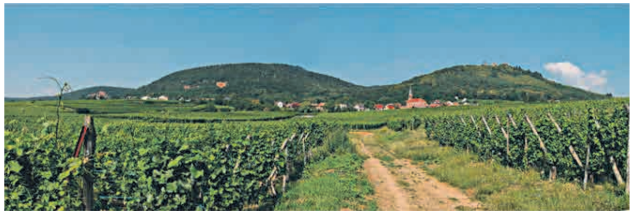
Weinberge bei Husseren-les-Châteaux

Vom 27.9 bis zum 2.10. sind in Husseren-les-Châteaux im Elsass Zimmer reserviert. Das Hotel hat einen beheizten Pool, Sauna, Tennisplatz und Pétanque. Ausflüge nach Colmar, Selestat, Breisach am Rhein, Ribeauvillé (ou Riquewih) und auf der Heimfahrt ins Ecomusée in Ungersheim sind geplant.